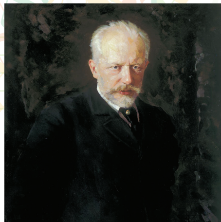
Пьотр Илич _____